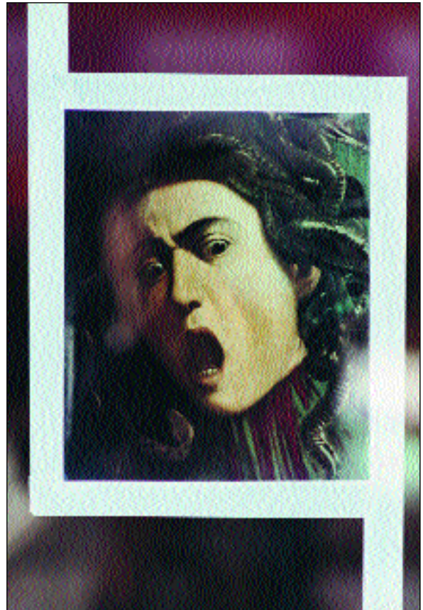
A ollada de Medusa (1990)