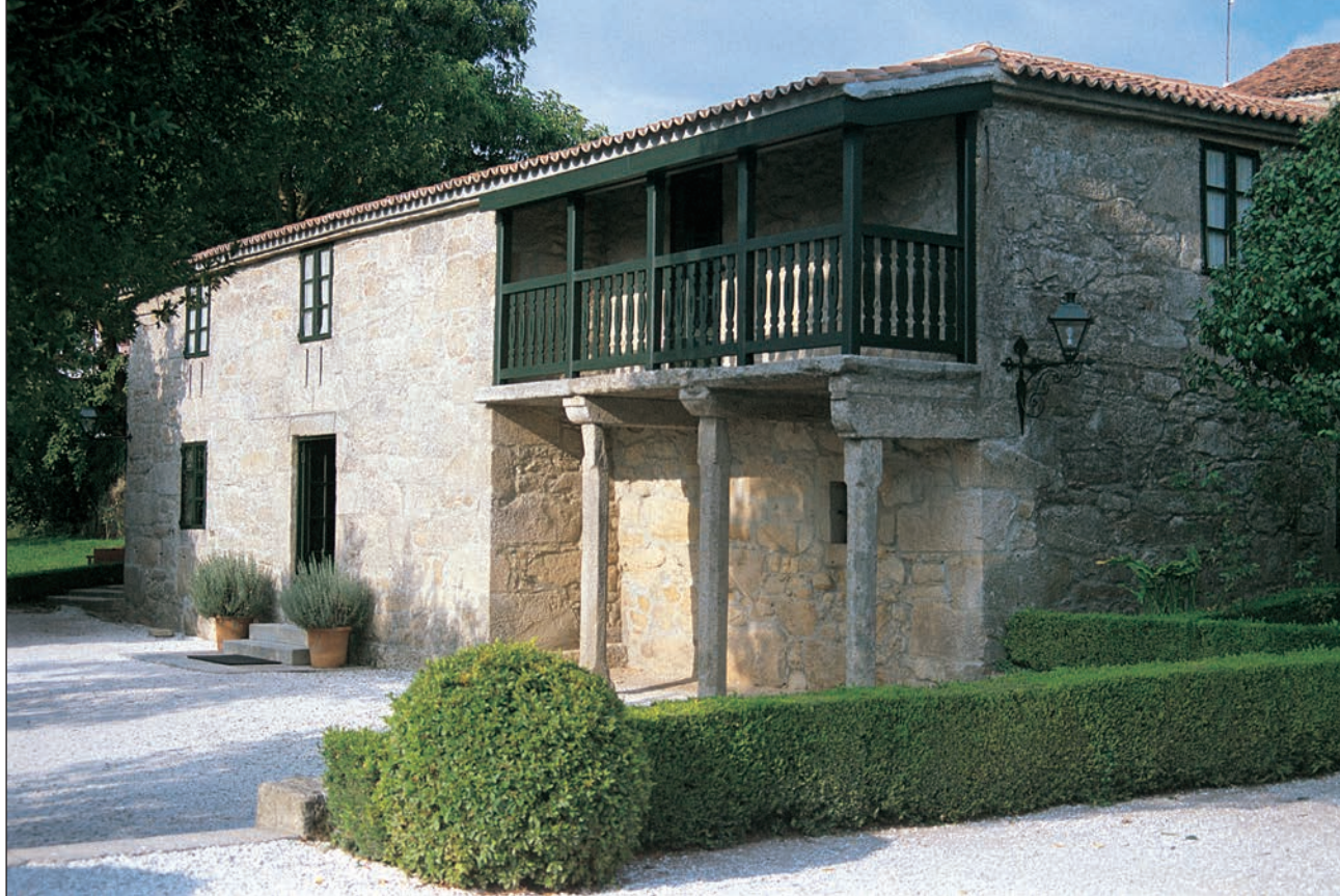
Pazo da Matanza de Padrón, onde viviu os seus derradeiros días Rosalía de Castro. Hoxe é o museo da poeta