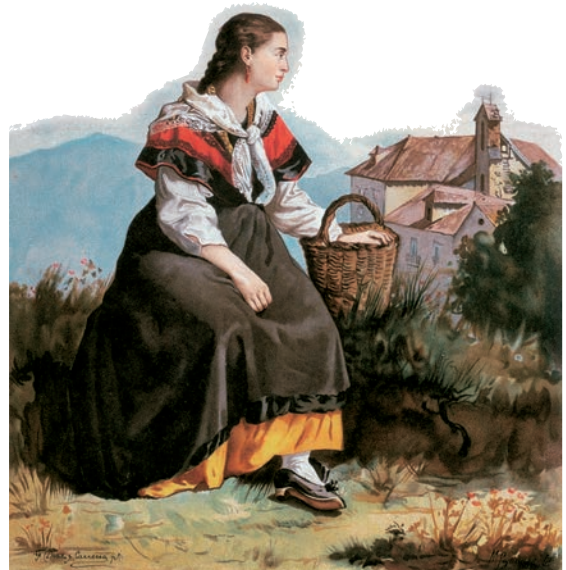
1. Miguel de Unamuno. Obras , VII, pp. 815-16. Citado por D. Basdekis, "Unamuno y Rosalía", Grial 2 (1966). Véxase Andanzas y visiones españolas , 1922.